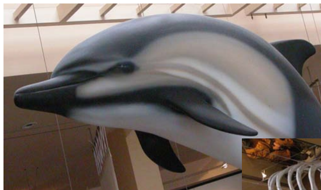
Un moule de dauphin

Une raison de plus pour ne pas jeter les poches plastique n'importe où.