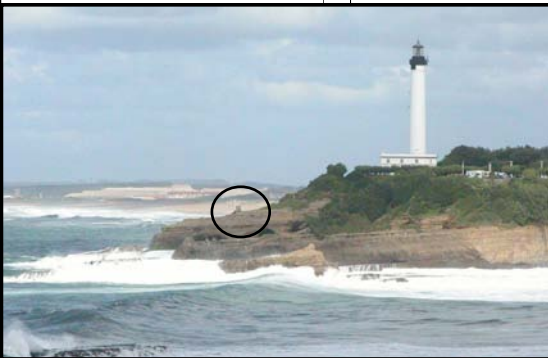
Le phare de Biarritz conserve à sa base les vestiges de la tour de guet d'où les chasseurs de baleines donnaient l'alerte dès qu'un cétacé était aperçu au large.

Nous sommes allés au Musée de la Mer à Biarritz. J'ai vu les phoques manger, cela m'a beaucoup plu.