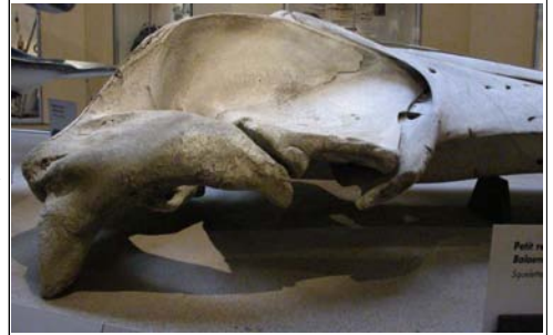
Crâne de petit Rorqual