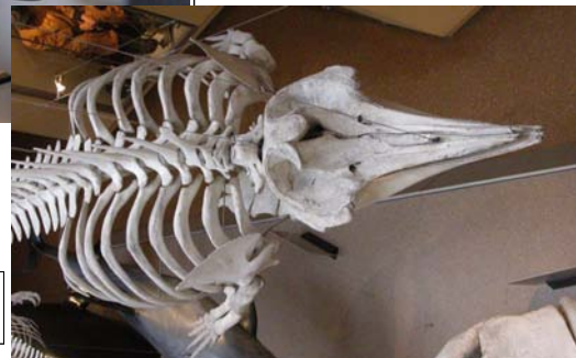
Un squelette de dauphin